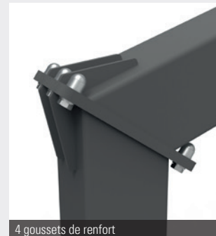
4 goussets de renfort