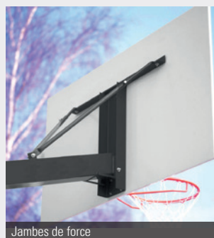
Jambes de force