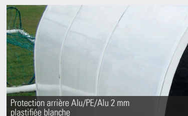
Protection arrière Alu/PE/Alu 2 mm plastifiée blanche