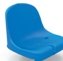
Option coque en plastique