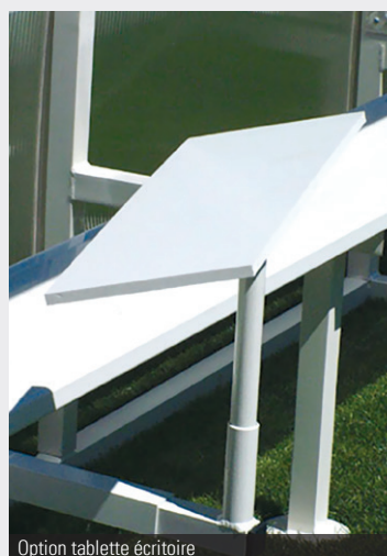
Option tablette écriteire